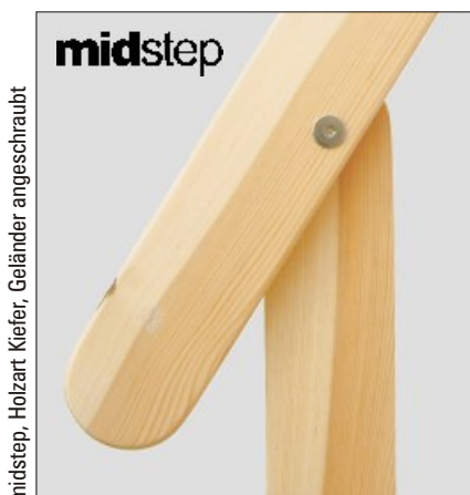
midstep, Holzart Kiefer, Geländer angeschraubt

Sie haben Fragen? Wir beraten Sie gerne: