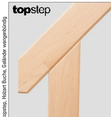
topstep, Holzart Buche, Geländer wangenbündig

Der liefert in nur 4 Stunden eine maßgenaue Zeichnung für Ihre topstep. Bei midstep prüft er den verfügbaren Bereich und die Kopffreiheit. Oder nutzen Sie den Produktkonfigurator: www.wellhoefer.de